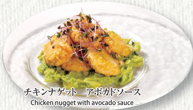
チキンナゲット アボカドソース Chicken nugget with avocado sauce