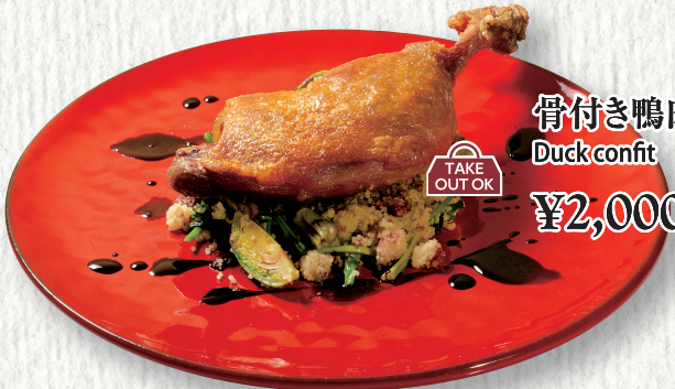
骨付き鴨肉のコンフィ Duck confit ¥2,000