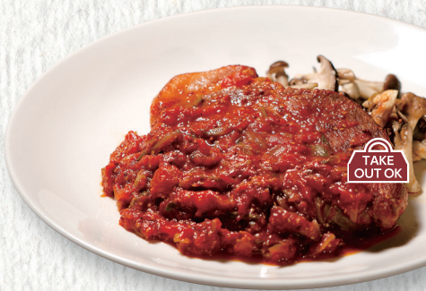
250gの豚肩ロースの シャルキュティエール Charcutiere of shoulder roasted pork ¥1,980