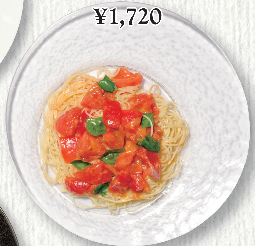
フレッシュトマトとバジルの 冷製スパゲッティ Cold spaghetti with fresh tomato & basil ¥1,720