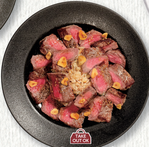
ステーキガーリックピラフ Steak strips with garlic rice ¥1,520 肉100g増量 ¥1,980