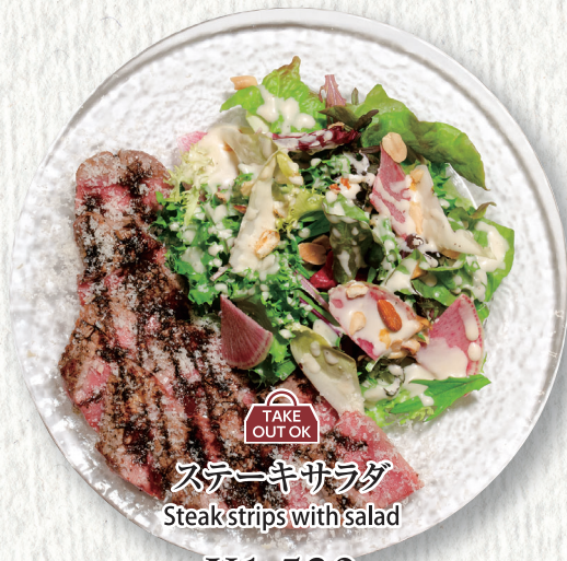
ステーキサラダ Steak strips with salad