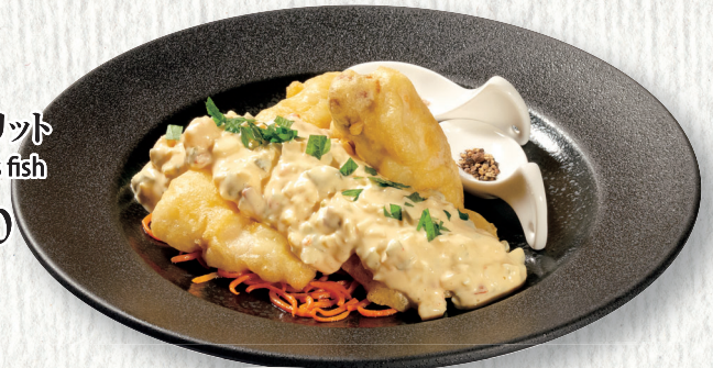
エビクリームコロッケ ビスクソース Cream croquette of shrimp in bisque sauce