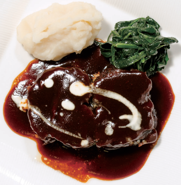
ビーフシチュー(パン付) Beef stew ¥3,400