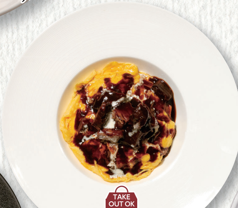
ビーフシチューオムライス Beef stew omelette rice ¥1,820